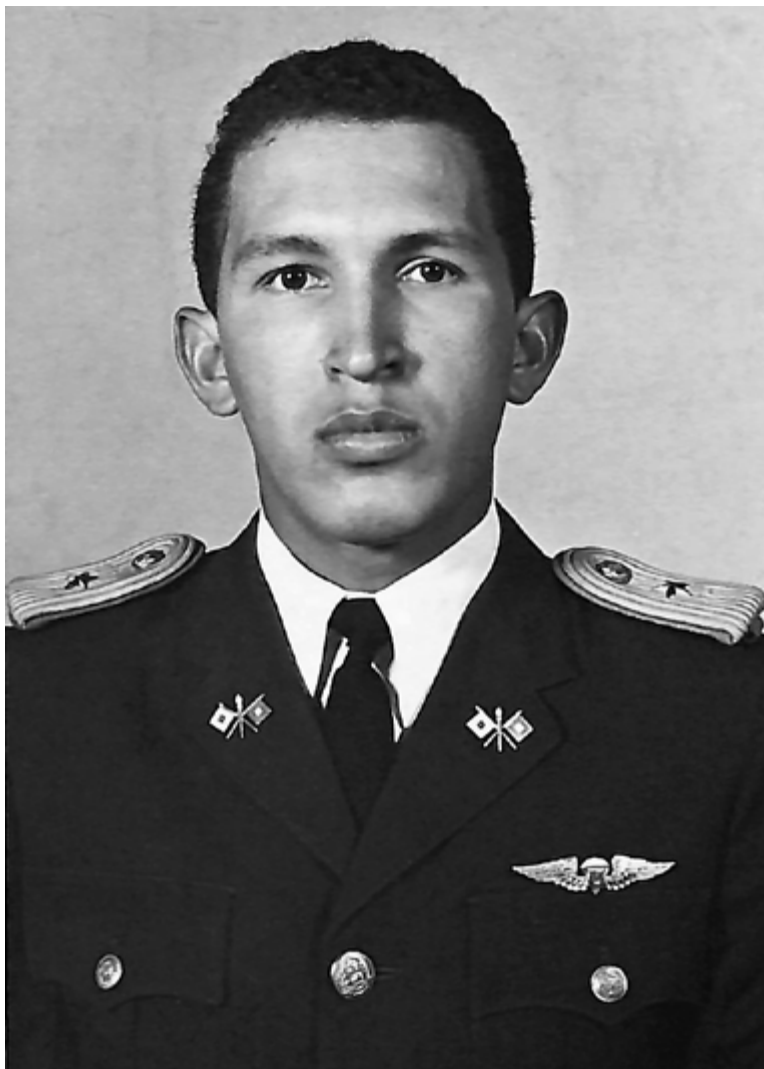
ENTRE 1975 Y 1978 EL SUBTENIENTE HUGO CHÁVEZ.