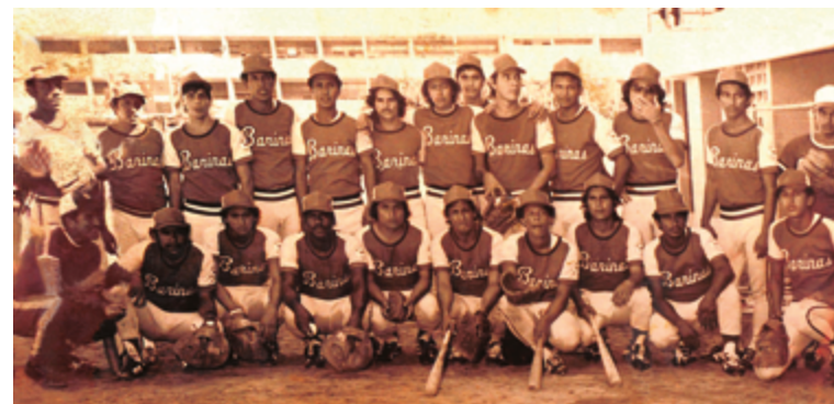
1976 HUGO CHÁVEZ (DE CUCLILLAS, FILA INFERIOR, PRIMERO DE DERECHA A IZQUIERDA) CON SUS COMPAÑEROS DEL EQUIPO DE BÉISBOL. ESTADO BARINAS, VENEZUELA.