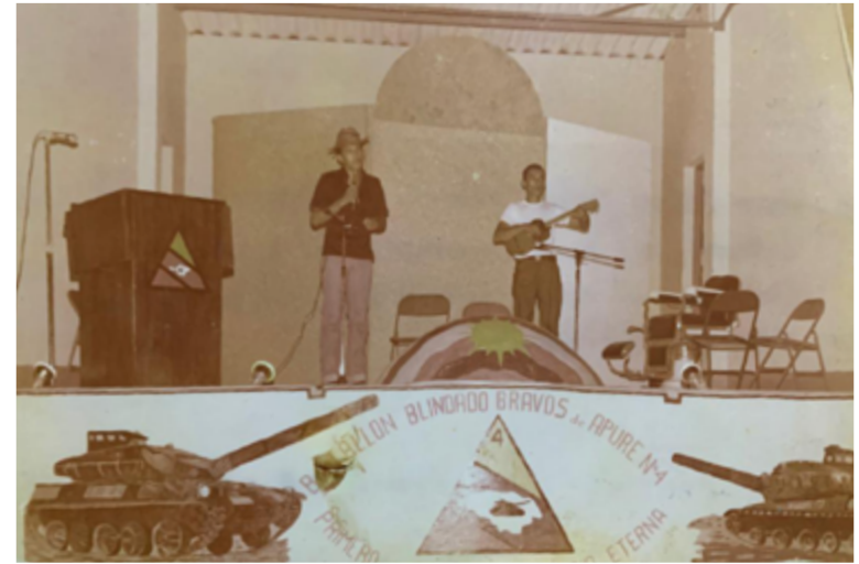
ENTRE 1978 Y 1981 EL TENIENTE HUGO CHÁVEZ (PRIMERO DE IZQUIERDA A DERECHA) EN UN ACTO EN EL BATALLÓN "BRAVOS DE APURE" DE MARACAY, ESTADO ARAGUA, VENEZUELA.