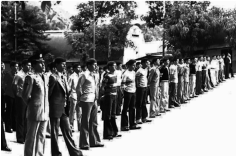
ENTRE 1978 Y 1981 EL TENIENTE HUGO CHÁVEZ (PRIMERA FILA, EN EL PRIMER LUGAR) EN UN ACTO DE LICENCIAMIENTO EN EL BATALLÓN "BRAVOS DE APURE" DE MARACAY, ESTADO ARAGUA, VENEZUELA.